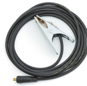
Earth return cable 5 m, 25 mm 2