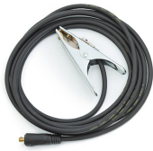
Earth return cable 5 m, 16 mm 2